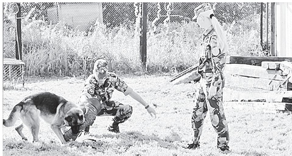
Немецкая овчарка выполняет одно из заданий