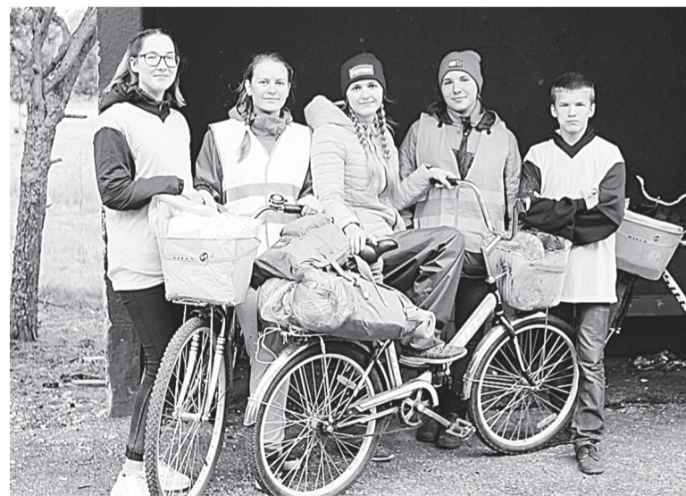
Ученики Кончанской школы преодолели на велосипедах более двухсот километров!

Конечно, боровичане не могли оставить без внимания озеро Каменское, на берегу которого стоит село. Его воды помнят непревзойдённого полководца. Посетили и храм Александра Невского, построенный в 1885 году. На третий день, полюбовавшись водопадами на реке Прикша, наконец, добрались до поляны слёта.