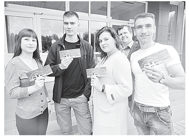
Работники «Кинопарка» приглашают в гости