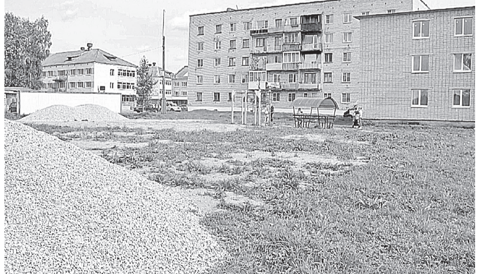
Скоро на этом месте появится современная спортивная площадка с уличными тренажёрами, брусью и футбольным полем